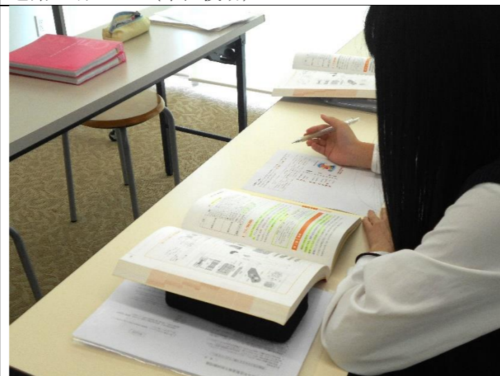
総合教養(製菓衛生師 国家試験対策)