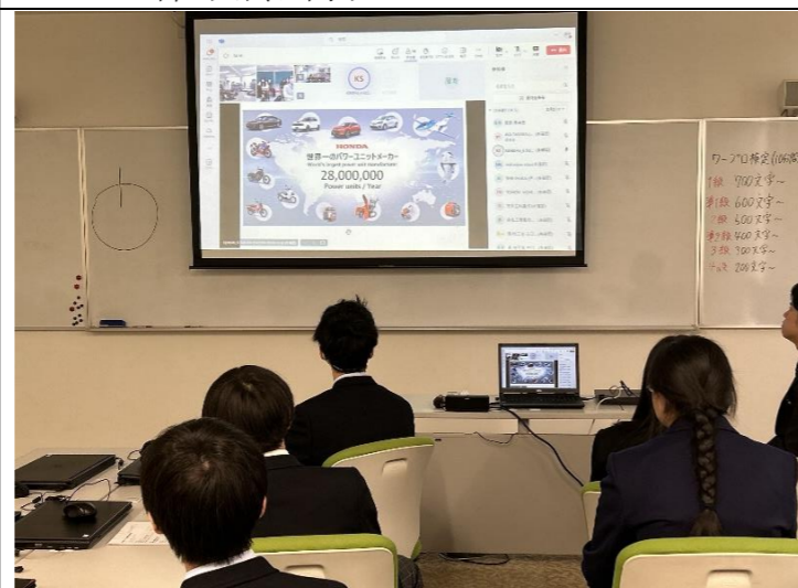
進路ガイダンス (本田技研)