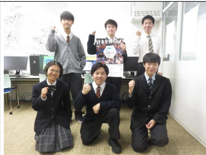
e スポーツ部 大会に向けて