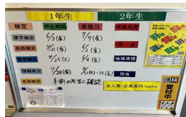
↑ 本校 2階掲示板