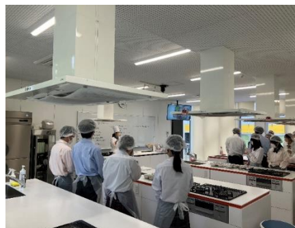
↑調理製菓授業 風景